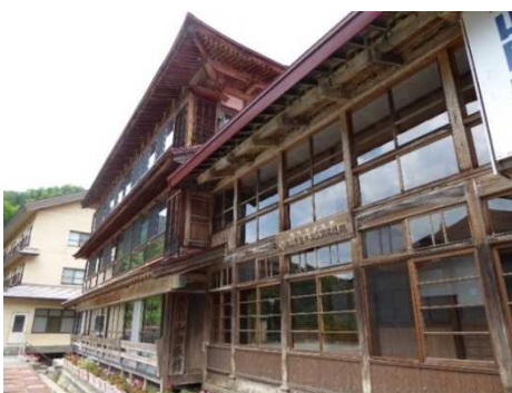
小谷温泉 大湯元 山田旅館